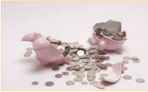
Hoegaarden is schuldenkampioen

Op de gemeenteraad van 10 februari hadden wij als enige oppositiepartij duidelijke kritiek op het gevoerde financiële beleid. De N-VA-fractie hekelde het gebrek aan ambitie bij de huidige meerderheid.