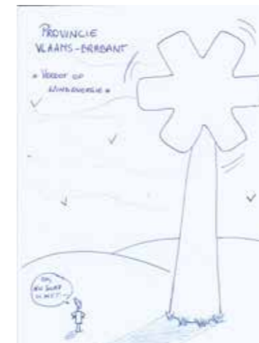
Provincie Vlaams-Brabant: Geen windplan, wel windturbines.