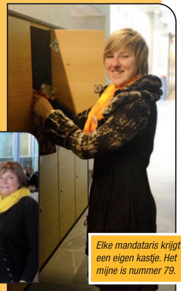
Elke mandataris krijgt een eigen kastje. Het mijne is nummer 79.

Geen afslanking van de bevoegdheden, de grootste partij in de oppositie, een lak aan respect voor de Vlaams-Brabantse kiezer... Zie hier de Vlaams-Brabantse provincieraad. De vraag 'Wat nu?' was dus snel beantwoord. Zo hard en sterk mogelijk oppositie voeren. Ze zullen het geweten hebben!