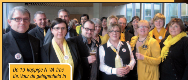
De 19-koppige N-VA-fractie. Voor de gelegenheid in zwart-gele outfit.