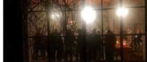
Pop-up Café: nieuwe data! p. 3