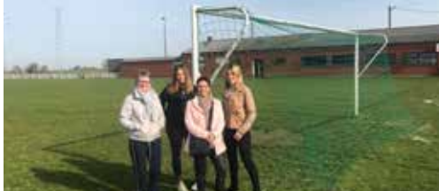
Voetbalterrein Outgaarden: oppositie loont p. 2